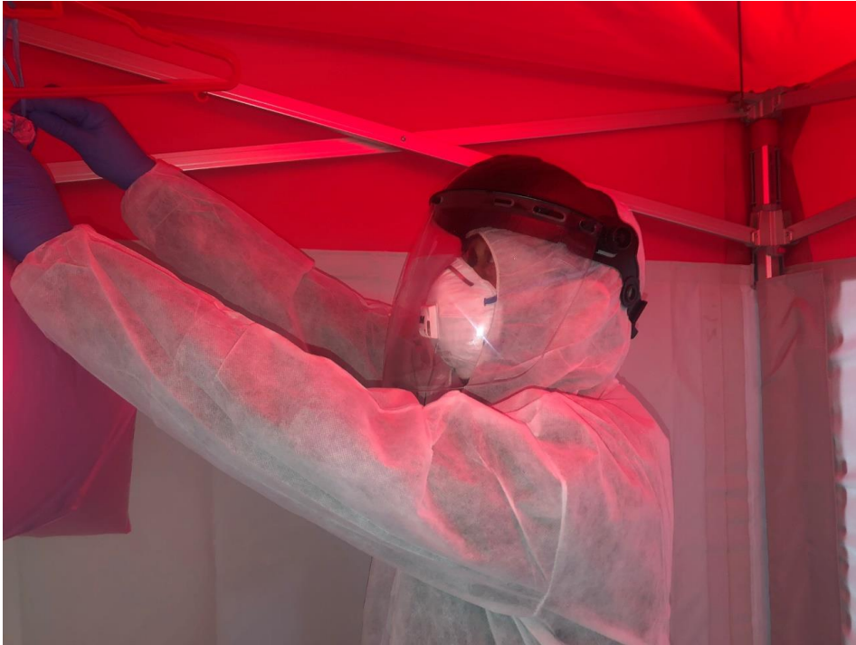
Persona con el EPI