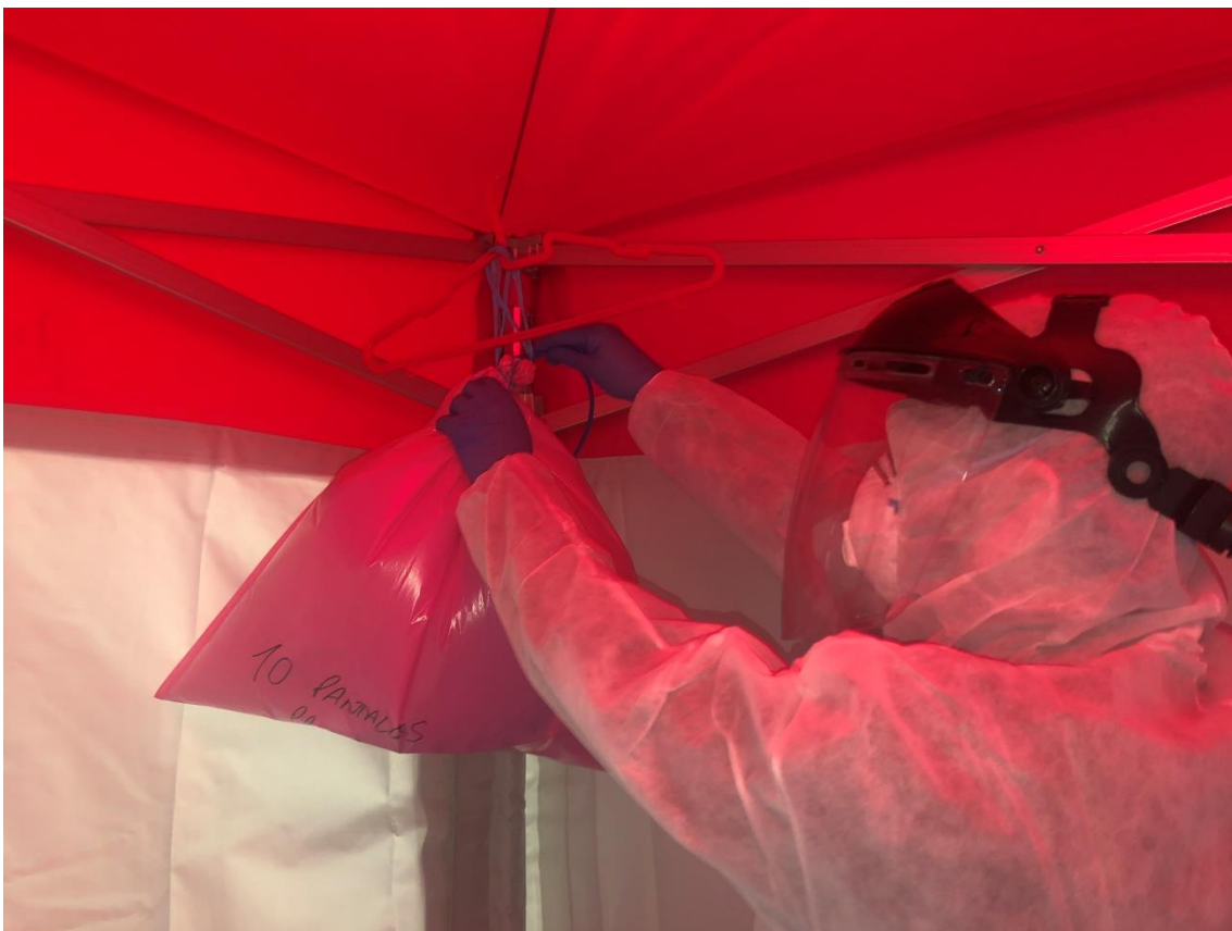
Introducción del tubo

Por favor, ante cualquier modificación de este protocolo, comunicarlo con anterioridad a través de las direcciones de correo facilitadas en este documento.