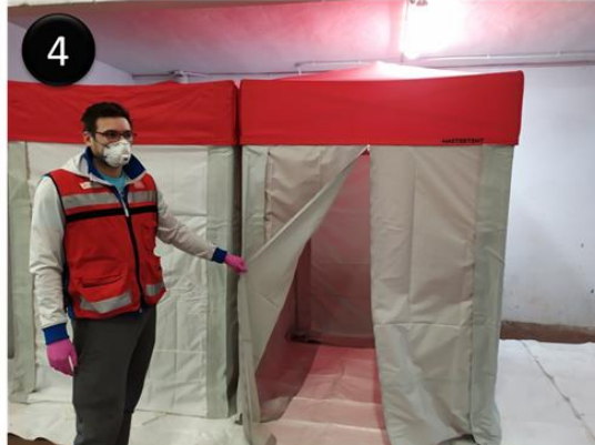
Figura: 1) Carpa habilitada para la recepción de las pantallas y 2) Zona de montaje y verificación. 3) y 4) Carpa reducida para la introducción de las pantallas a desinfectar.