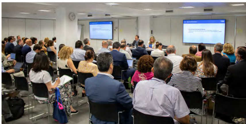
Reunión de constitución del CTN 323 'Economía circular'

El CTN 323 tiene por objetivo el desarrollo de estándares horizontales que faciliten a las organizaciones alcanzar sus objetivos en el ámbito de la economía circular. Habilita la representación de los intereses españoles en los trabajos de normalización en los ámbitos internacional y europeo y, al mismo tiempo, da cabida a iniciativas nacionales transversales en esta materia.