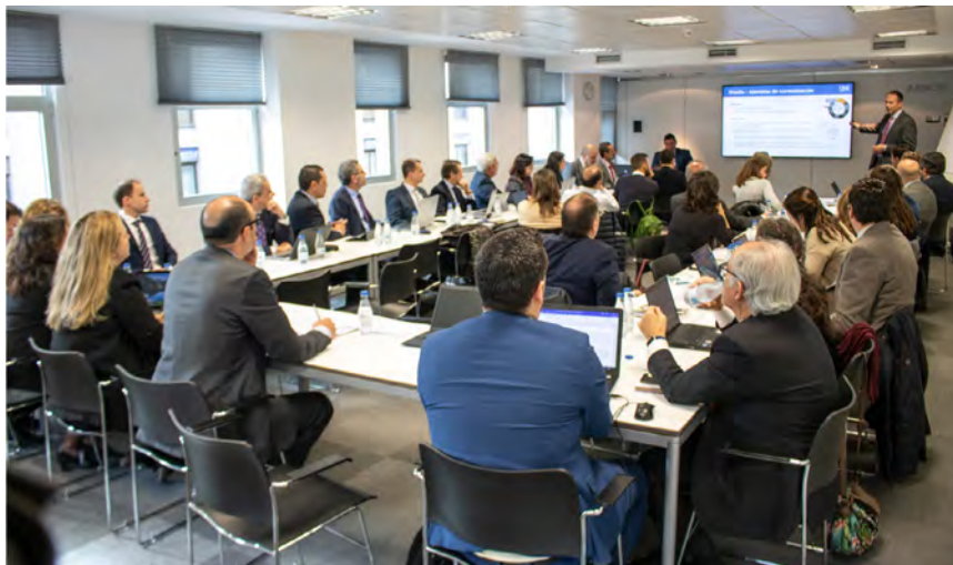
Primera reunión de la Comisión Consultiva de Economía Circular

Impulsar la creación de un comité de normalización en materia de economía circular. Este punto se desarrolla en el siguiente apartado.